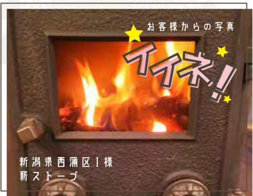
新潟県西蒲区I様 薪ストーブ