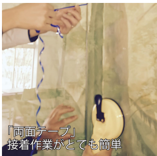
「両面テープ」 接着作業がとても簡単

接着と一口にいっても3つの方法があります。1つは「コーキング」による接着です。施工としては、コーキング剤を充填して、ヘラで仕上げるものです。最も一般的で接着力も高く、かつ安全な接着方法です。