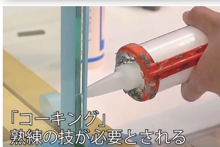
「コーキング」 熟練の技が必要とされる