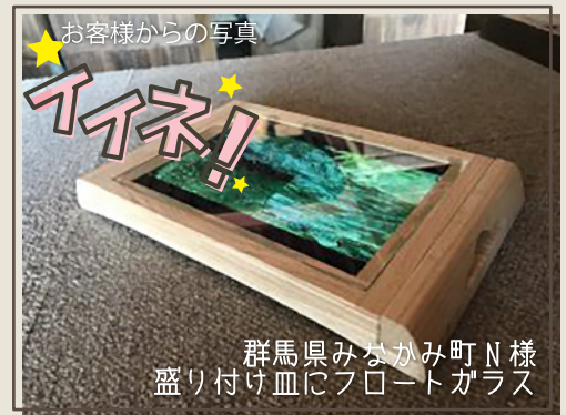
お客様からの写真