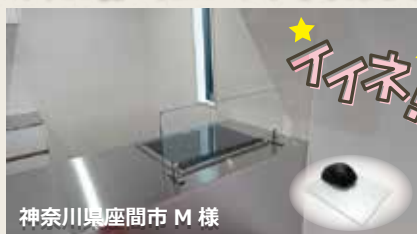
神奈川県座間市 M 様

購入いただいた商品の設置写真と必ず「KG 通信を見た」の一言を添えて送っていただきますと、もれなく【ガラス製マウスパッド】プレゼントいたします！