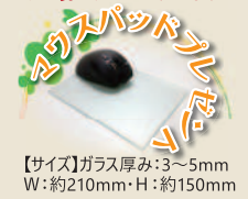
【サイズ】ガラス厚み:3~5mm W:約210mm・H:約150mm