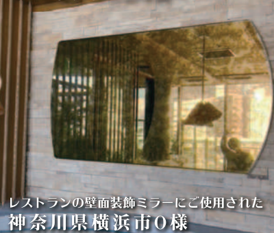
レストランの壁面装飾ミラーにご使用された 神奈川県横浜市O様