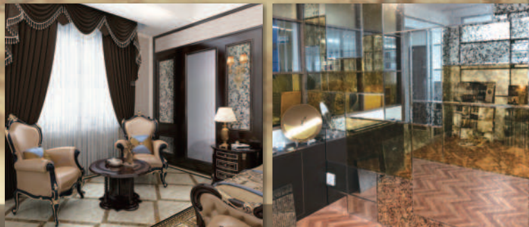
▲グランジミラー施工例