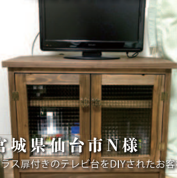
宮城県仙台市N様 ガラス扉付きのテレビ台をDIYされたお客様