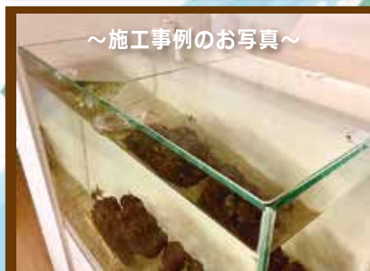
~施工事例のお写真~

敷地内のアスファルトを整備しました!以前と比べアスファルトの凹凸が少なくなったことで荷台のがたつきが軽減され、ガラスを運びやすくなりました。万が一ガラスが割れたとしても掃除しやすく、お客様や業者の方が安心して出入りできる環境に変身しました!