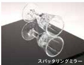
スパッタリングミラー