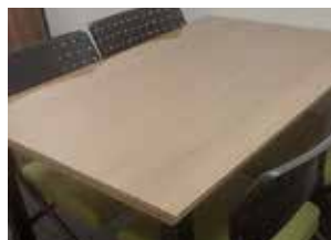
テーブルの上に強化ガラスを設置